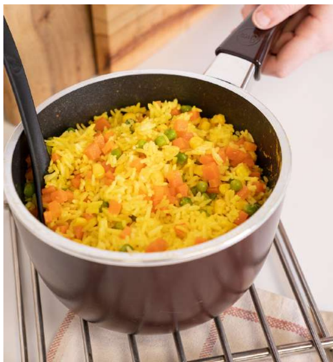
Arroz con verduras

Sugerí estas recetas destacando las funciones y los beneficios de Cocinar con Essen.